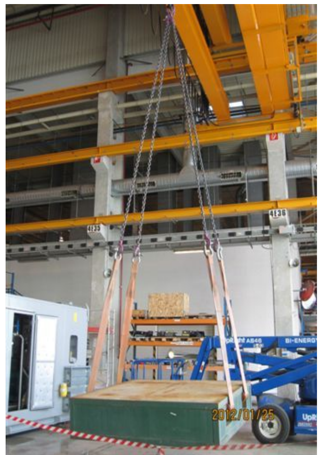
Híddaru fővizsgálata (behajlás vizsgálata)