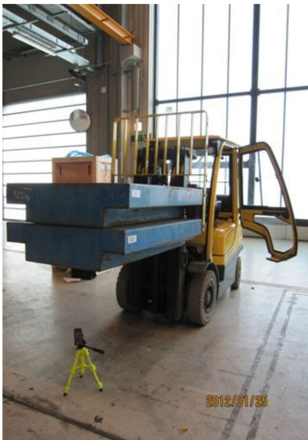
Targonca fővizsgálata (tehersüllyedés vizsgálata)

MSZ EN ISO 12100:2011 Gépek biztonsága. A kialakítás általános elvei. Kockázatértékelés és kockázatcsökkentés (ISO 12100:2010)